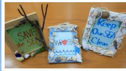
海にあるものでフォトフレームを飾ろう