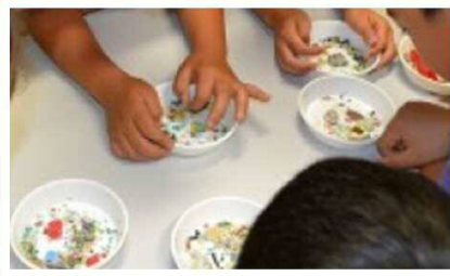
マイクロプラスチック収集体験。富山の海にもあるかも