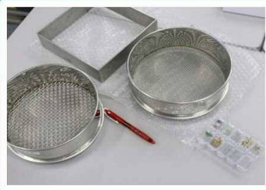
調査で使われている本格的なキット