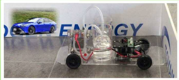
燃料電池自動車はどんな仕組みで走るのかな？