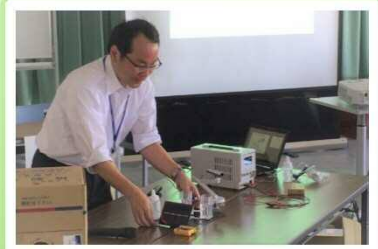
水素をいろいろな方法で作ってみよう