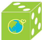
かんせい 完成見本